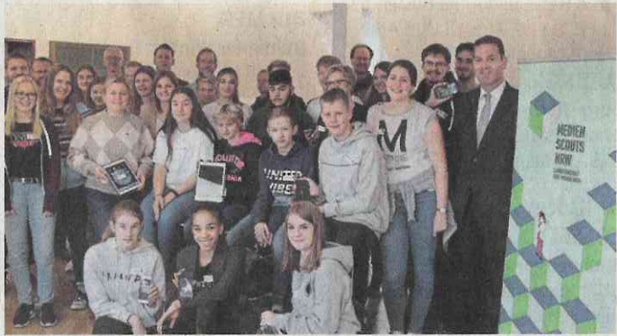
Mit Unterstützung der Sparkasse fand die Workshop-Reihe für die neuen Medienscouts statt.